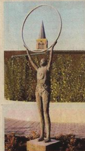
De twee beelden verwelkomen iedereen die het gebouw binnenkomt.

als laureate uit de bus. Haar kunstwerk geeft het best de filosofie van De Tandem weer. Het bestaat uit twee beelden die naar elkaar gericht staan aan de ingang en op die manier iedereen verwelkomen die het gebouw binnenstapt. Die filosofie houdt in dat er samengewerkt wordt. Net als in het zorgcentrum met verzorgers en bewoners, vullen de twee beelden elkaar aan. Begin 2012 vindt de officiële huldiging plaats.